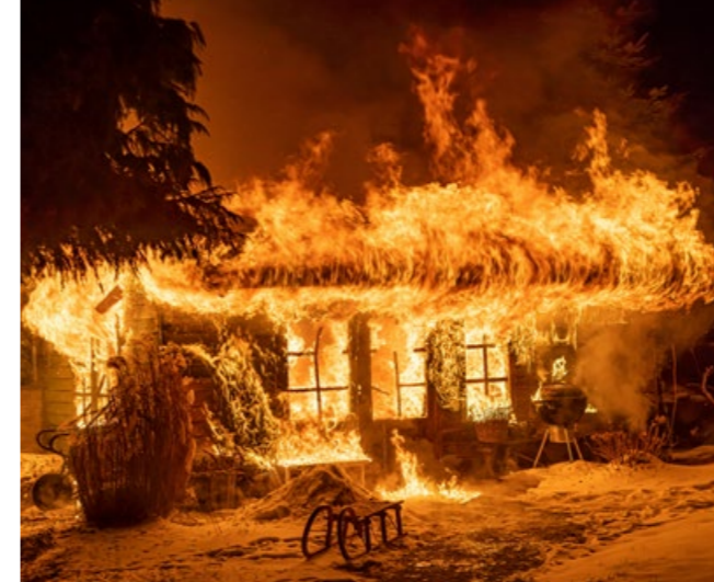
Middelbrand in tuinhuis in Nieuwleusen.