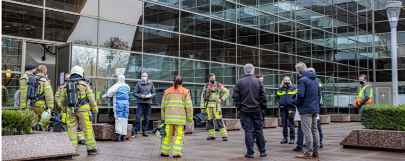
Brief met onbekende stof aangetroffen op postkamer Waterschap Drents Overijsselse Delta in Zwolle. Dit bleek uiteindelijk zout.