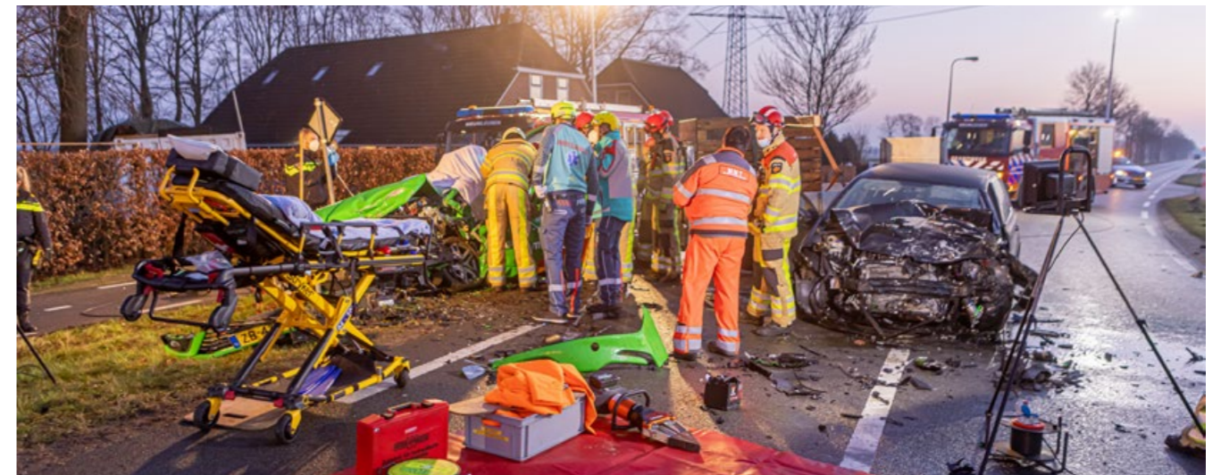
Ongeval met dubbele beknelling in Nieuwleusen.