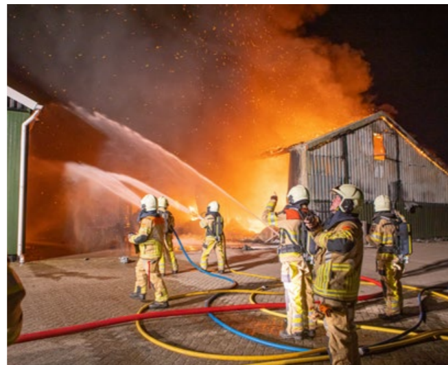
Zeer grote brand bij firma Braakman in Laag Zuthem.