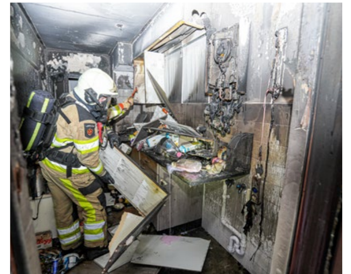
Forse keukenbrand in flat Palestrinalaan Zwolle.