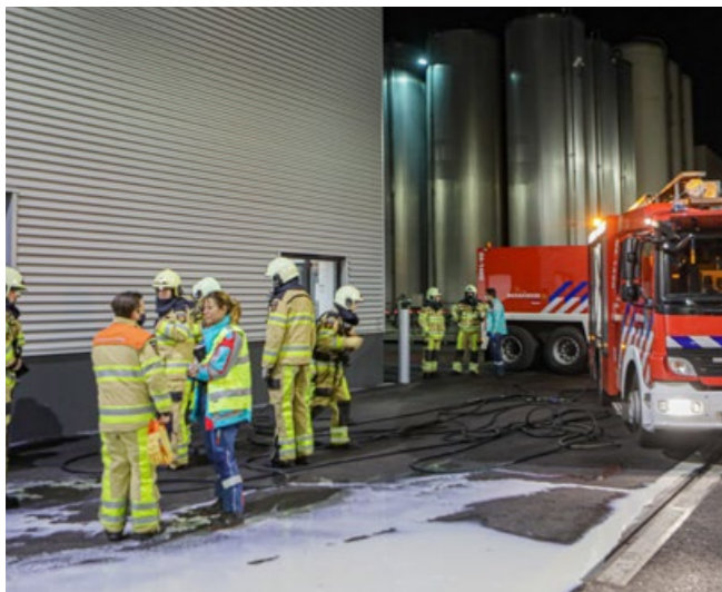
Explosie bij bedrijf in Kampen, slachtoffer vervoerd naar ziekenhuis in Zwolle.