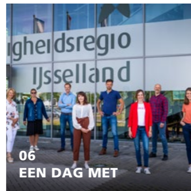
06 EEN DAG MET