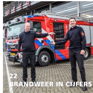
22 BRANDWEER IN CIJFERS