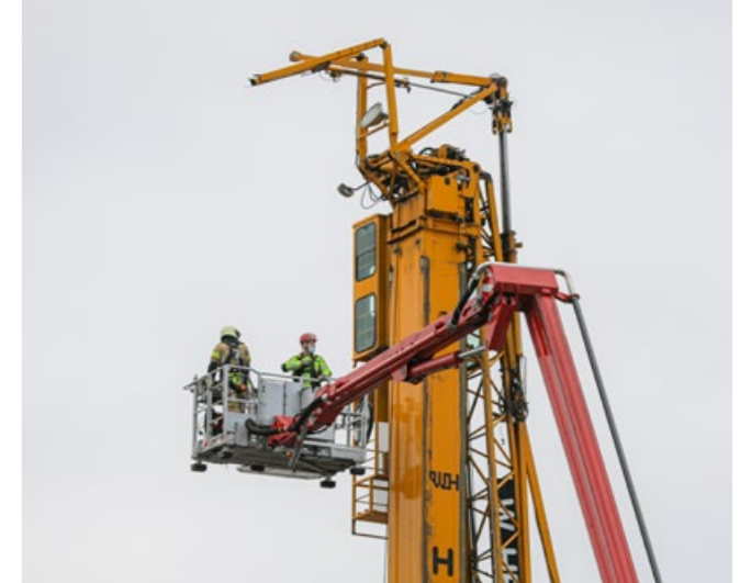
Assistentie vanuit Zwolle bij ongeval met kraan in Hattem.