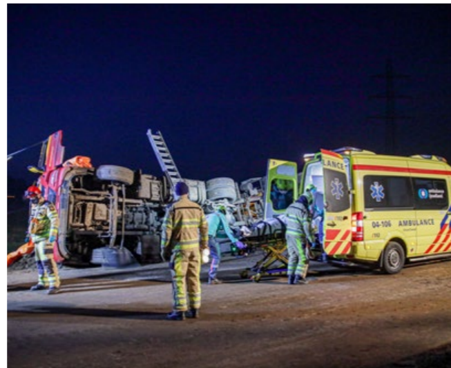
Twee vrachtwagens binnen één uur gekanteld in Zwolle op het nieuwe N340 traject.