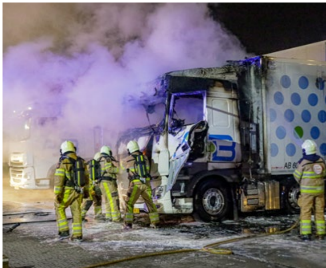
Middelbrand in vrachtwagen op bedrijventerrein Hardenberg.