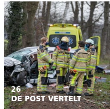
26 DE POST VERTELT