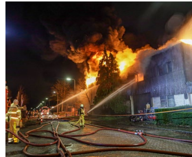
Zeer grote brand GRIP 1 Gilzestraat in Kampen.